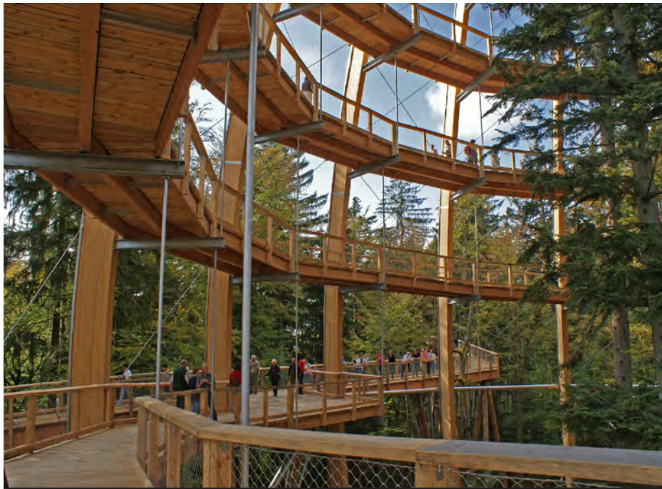
Eingang vom Pfad in den Baumturm