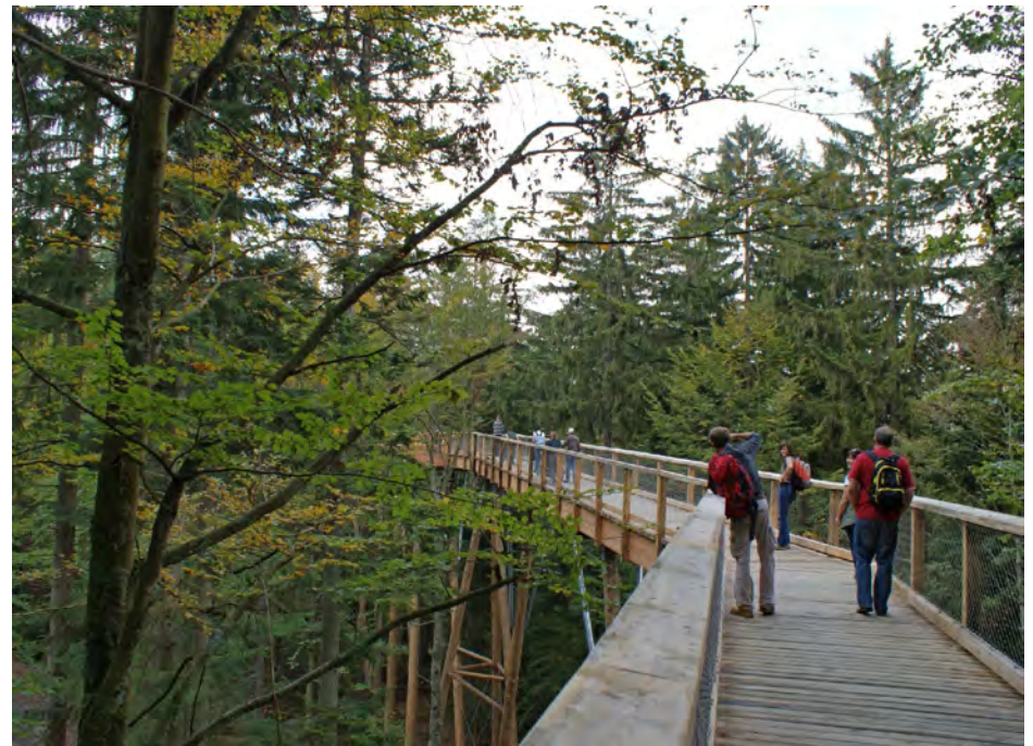
Unterwegs auf dem Pfad Fotografie die erlebnisAKADEMIE Altenerder