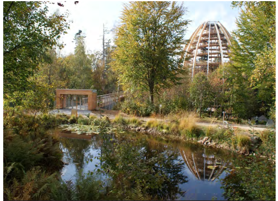
Baumturm mit Ausgang Pfad Fotografie die erlebnisAKADEMIE Altenerder