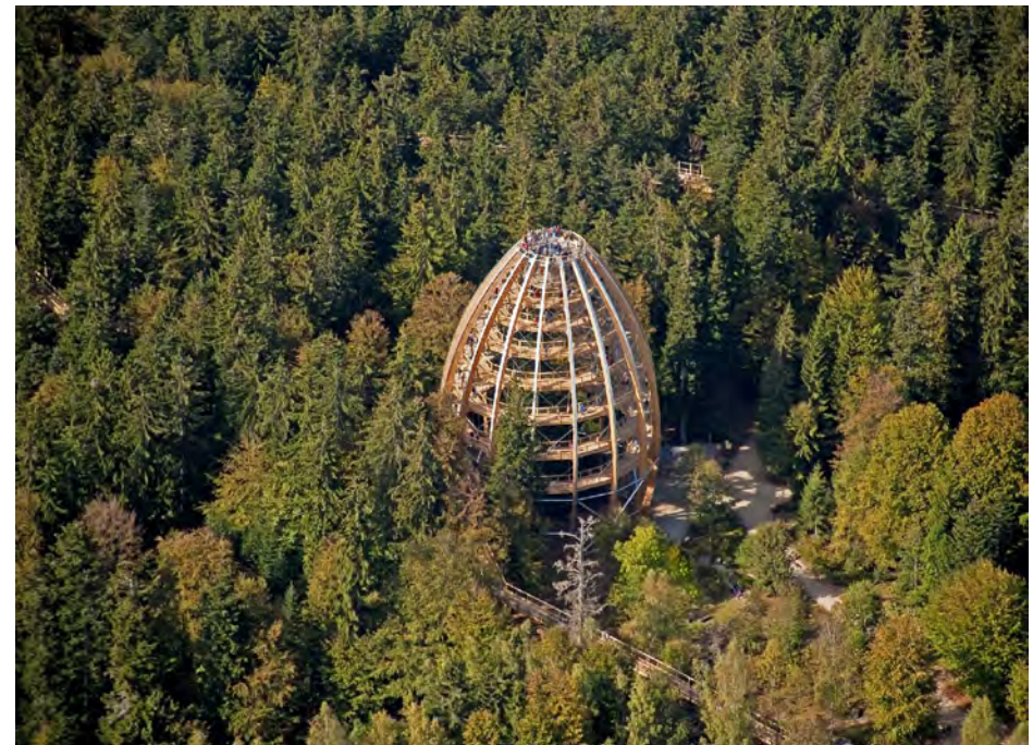
Baumturm aus der Vogelperspektive